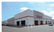
コストコホールセール壬生倉庫店 約350m~400m (徒歩5分)