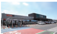
カインズ 約260m~310m (徒歩4分)