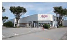
イオン 約600m~700m (徒歩9分)

南犬飼中学校..... 約3,100m~3,200m ビバホーム..... 約720m~820m