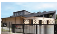
森の子保育園 約850m~900m (徒歩12分)