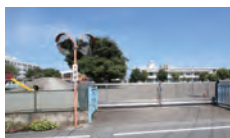
睦小学校 約280m~380m (徒歩5分)