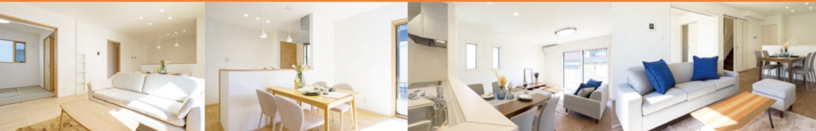
No.1 内観 (左側2枚)