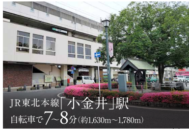
JR東北本線「小金井」駅 自転車で7~8分(約1,630m~1,780m)