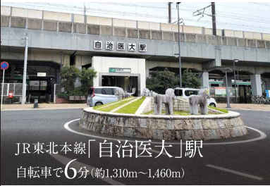
JR東北本線「自治医大」駅 自転車で6分(約1,310m~1,460m)

東京駅方面へ 朝7時～8時台の電車本数 ※1 ・「自治医大」駅より 9本 ・「小金井」駅より 13本