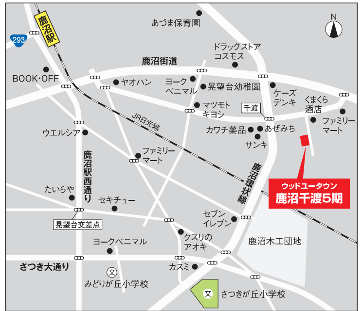
《学区：さつきが丘小学校・北中学校》