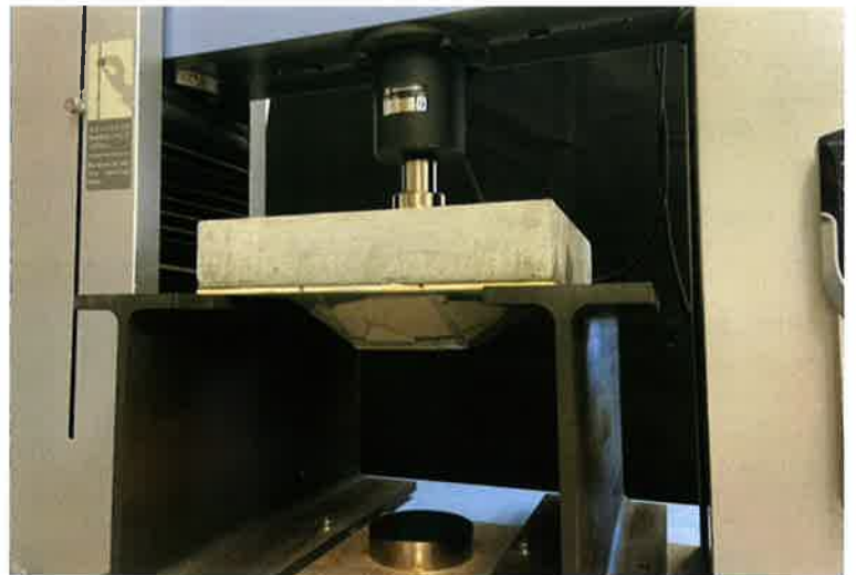
コンクリート押し抜き試験状況で耐久性が実証されました